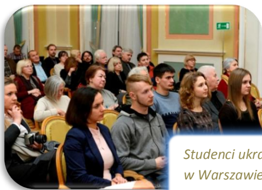
Studenci ukraińscy z Wyższej Szkoły Menedżerskiej w Warszawie 27.02.2014

➤ W spotkaniach wzięło udział łącznie ponad 2 500 uczestników , w tym oprócz osób prywatnych przedstawiciele instytucji państwowych i organizacji pozarządowych, uczelni wyższych, fundacji, stowarzyszeń, firm, a także studenci polscy i ukraińscy