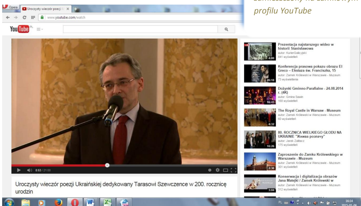
Film z uroczystego wieczoru poezji ukraińskiej 14.03.2014 zamieszczony na zamkowym profilu YouTube

Wszystkie spotkania były rejestrowane, a relacje video z wybranych spotkań można obejrzeć na zamkowym profilu YouTube oraz na stronie portalu Wszechnica.org.pl.