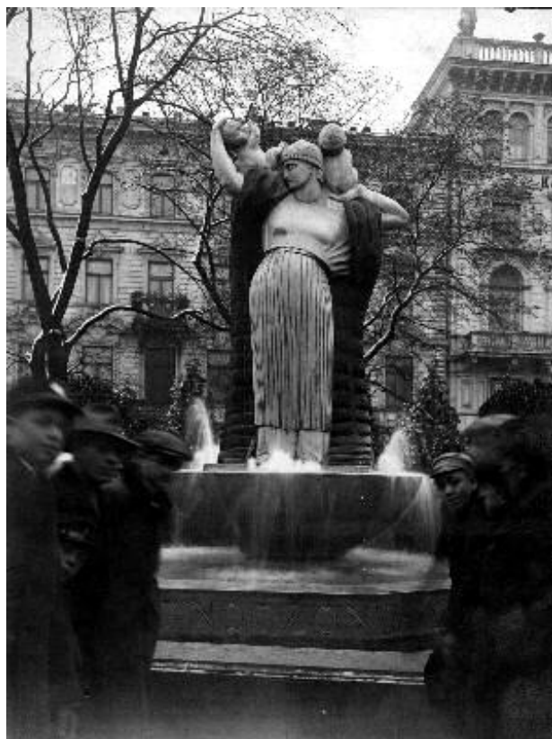
Pomnik Wdzięczności dla Stanów Zjednoczonych Ameryki, dłuta Xawerego Dunikowskiego, skwer Hoovera na Krakowskim Przedmieściu, (w uznaniu pomocy zorganizowanej przez Hoovera, odsłonięty 22 października 1922 r.)

Prezentowane na wystawie obiekty – fotografie, dokumenty archiwalne, materiały prasowe i pamiątki, pochodziły przede wszystkim ze zbiorów amerykańskich, z kolekcji Hoover Institution Archives w Palo Alto, Herbert Hoover Presidential Library w West Branch, State Historical Society of Iowa, a także – dzięki współpracy z Naczelną Dyрекcją Archiwów Państwowych – z zasobów archiwów polskich, głównie Archiwum Akt Nowych.