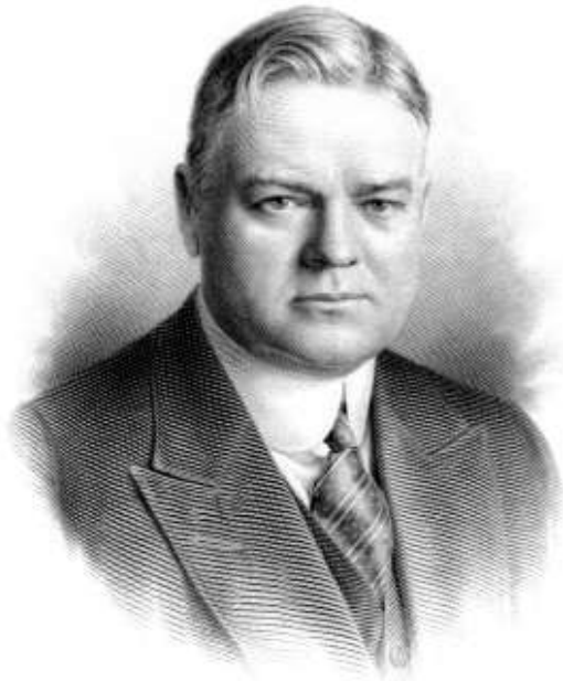
Herbert C. Hoover 1929

Herbert Clark Hoover (1874 – 1964), ceniony ekspert górniczy, międzynarodowy doradca wielu spółek wydobywczych na całym świecie, jeden z bardziej znanych amerykańskich polityków w międzywojennej Europie, sekretarz do spraw handlu, wreszcie prezydent USA, pochodził z ubogiej rodziny wiejskiego kowala ze stanu Iowa. Wcześniej osierocony, poznał smak biedy i samotności. Jednak dzięki ciężkiej pracy i uporowi w zdobywaniu wykształcenia, wspierany głęboką wiarą, piął się niezwykle szybko po szczeblach kariery zawodowej i politycznej, by wreszcie w 1929 r. osiągnąć najwyższe stanowisko w państwie – fotel Prezydenta Stanów Zjednoczonych Ameryki, który zajmował do roku 1933.