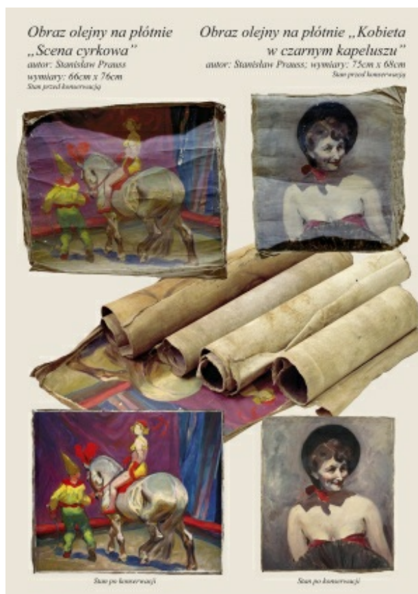
rys. 5. Obrazy olejne: "Scena cyrkowa", autor: Stanisław Prauss "Kobieta w czarnym kapeluszu", autor: Stanisław Prauss