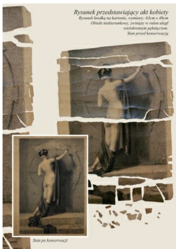
rys.4. Rysunek przedstawiający akt kobiety

oraz wiele obrazów olejnych, rysunków, plakatów, dyplomów, listów, druków