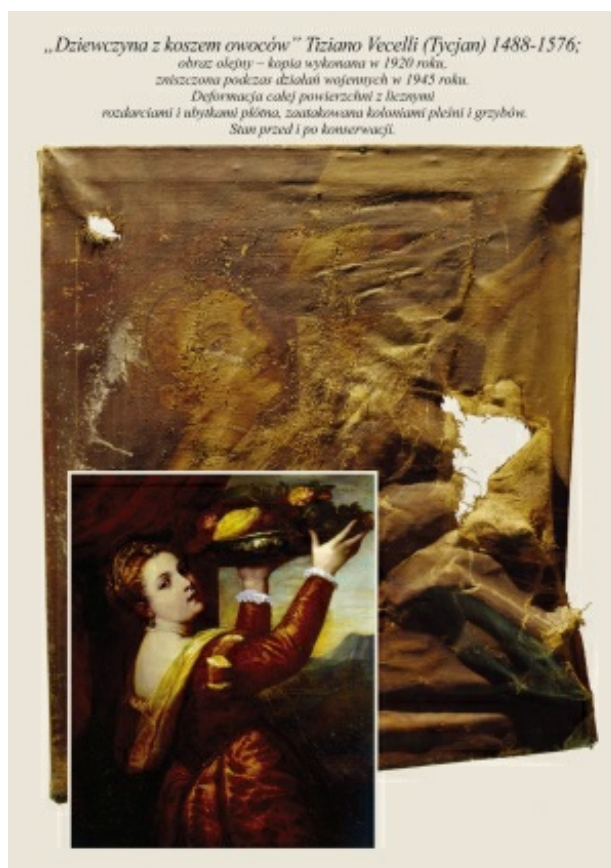
rys. 1. Dziewczyna z koszem owoców Tiziano Vecelli (Tycjan) 1488 – 1576 obraz olejny – kopia wykonana w 1920 roku, zniszczona podczas działań wojennych w 1943 roku. Deformacja całej powierzchni z licznymi rozdarciami i ubytkami płótna, zaatakowana koloniami pleśni i grzybów. Stan przed konserwacją i po niej

A oto, jak o swojej pracy opowiadali autorzy wystawionych dzieł: