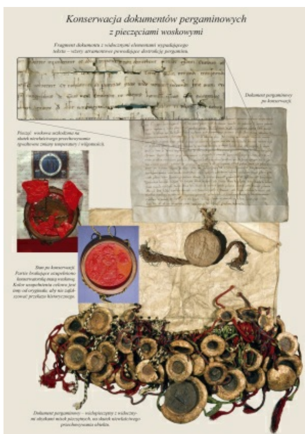
rys.2. Konserwacja dokumentów pergaminowych z pieczęciami woskowymi