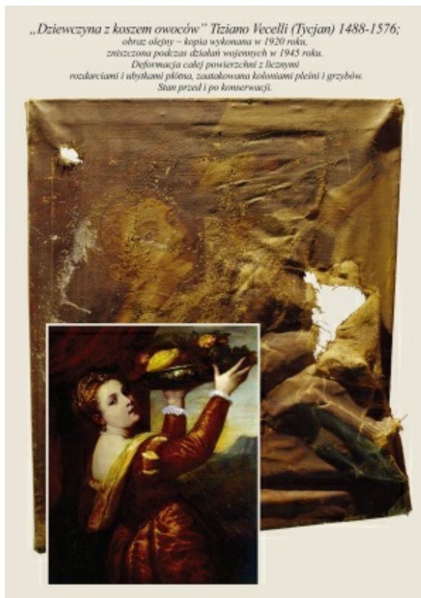
rys. 1. Dziewczyna z koszem owoców Tiziano Vecelli (Tycjan) 1488 – 1576 obraz olejny – kopia wykonana w 1920 roku, zniszczona podczas działań wojennych w 1945 roku. Deformacja całej powierzchni z licznymi rozdarciami i ubytkami płótna, zaatakowana koloniami pleśni i grzybów. Stan przed konserwacją i po niej

A oto, jak o swojej pracy opowiadali autorzy wystawionych dzieł: