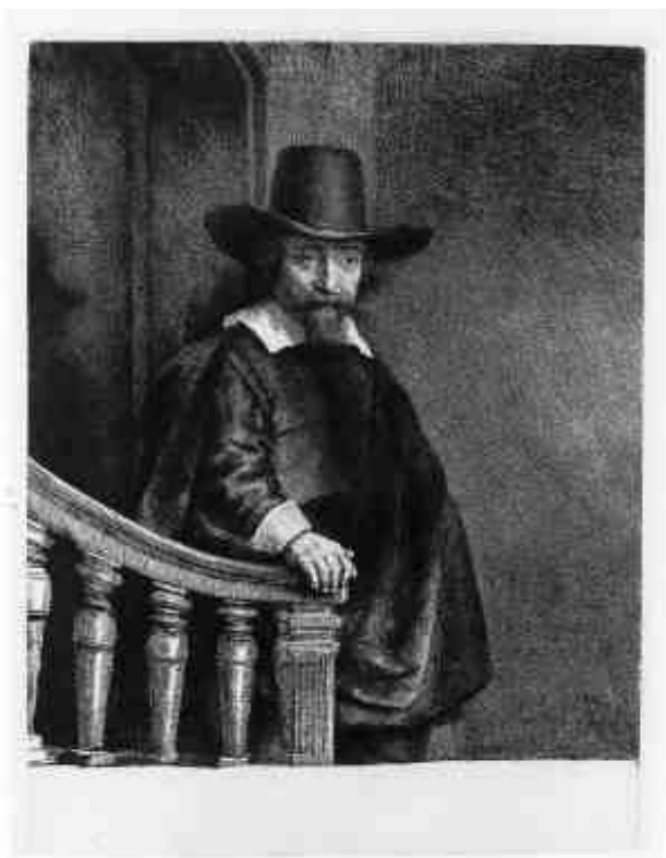
Uczony Ephraim Bueno , 1647, akwaforta, sucha igła i rylec, stan II, 241 x 177 mm.

Wystawie towarzyszył sklepik z pamiątkowymi drobiazgami, nawiązującymi do graficznego dorobku Rembrandta. Szczególną atrakcją stanowiły współczesne odbitki wybranych rycin artysty.