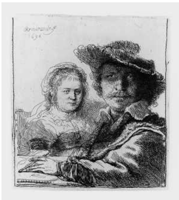
Autoportret z Saskią , 1636, akwaforta, stan I, 104 x 95 mm.

Ekspozycja poświęcona została twórczości graficznej Rembrandta van Rijn. Grafika, obok malarstwa i rysunku, stanowi znaczącą część artystycznego dorobku Rembrandta. Był niekwestionowanym mistrzem w tej dziedzinie i do dzisiaj uznawany jest za jednego z najwybitniejszych grafików europejskich. Za życia znany był nawet bardziej jako twórca rycin ze względu na większą łatwość docierania grafiki do szerokich kręgów odbiorców.