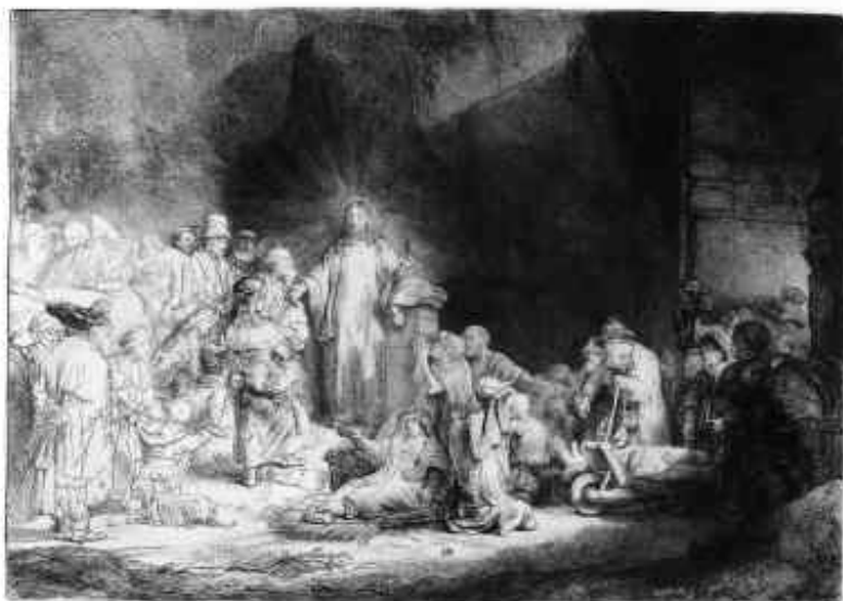
Chrystus nauczający ("Rycina Stuguldenowa"), około 1643 – 49,

akwaforta z suchą igłą i rylec, stan II, 278 x 388 mm.