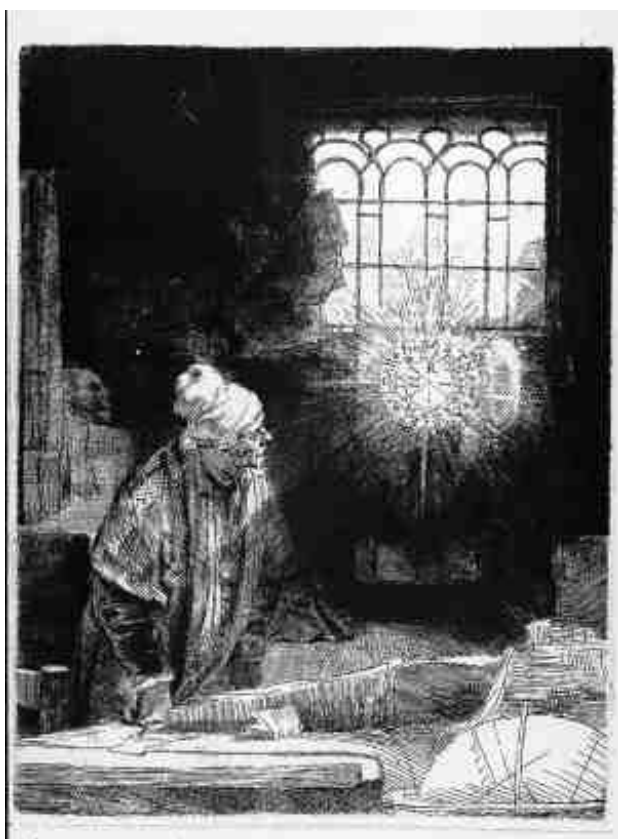
Faust , około 1652, akwaforta, sucha igła i rylec, stan II, 210 x 160 mm.

akwaforta z suchą igłą i rylec, stan II, 278 x 388 mm.